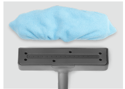
Houder microvezeldoek - SP240

De bezem-dweil met stoom is bedoeld voor de reiniging en desinfectie van gladde oppervlakken zoals vloeren, muren en plafonds. In combinatie met een microvezeldoek laat deze bezem geen enkele kalkafzetting achter op de behandelde oppervlakken.